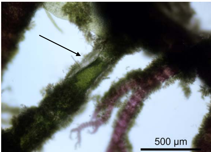
Een vastgehecht exemplaar, epifytisch op Ceramium . Detail van een basele cel.