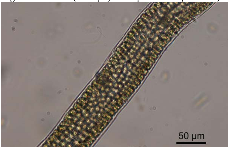
Cellen duidelijk in lengte- en dwarsrijen geplaatst