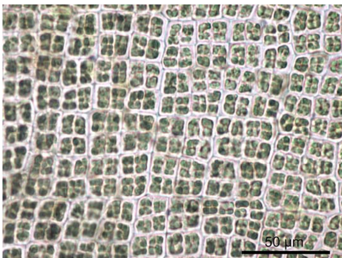
Oppervlakte-aanzicht: de cellen liggen in vierkante groepjes, resulterend in een dambordpatroon.